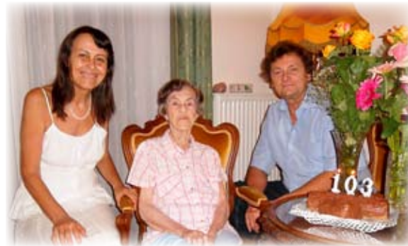
Édesanyja 103. születésnapján a testvérével

– A művészet holisztikus, másként nem művészet. Budapesten nőttem fel, zeneszerető családban. Édesapám hegedűművésznek készült, később gépészmérnök lett, de szenvedélye maradt a zene és a fotózás. Szüleim 6 éves koromtól rendszeresen vittek operába, komolyzenei koncertekre. Hétévesen kezdem zongoraórákra járni. Nagy boldogság volt számomra, amikor apámmal együtt játszottam, a közös muzsikálásban felolvadtam. Valóban zongoristának készültem, de 16 éves koromban egy tornaorai baleset közbeszólt. A mindkét karomat érintő ideg sérülés megvívta ezt az élettervet, és más utat jelölt ki helyette, így a Zeneakadémia helyett az Eötvös Loránd Tudományegyetemre iratkoztam be. A zene azonban azóta is spirituális élményként hat rám, minden sejtemben gyönyörűséget érzek. Hasonló élményt jelent egy-egy szépirodalmi mű olvasása is, vagy például a festészet: amikor láttam Milánóban Leonardo da Vinci Utolsó vacsoráját, elállt a lélegzetem a gyönyörűségtől. Ekszztatikus élményt jelentenek a templomépítészet remekművei, különösen a gótikus katedrálisok, amelyekben megélem a hálát, a belső