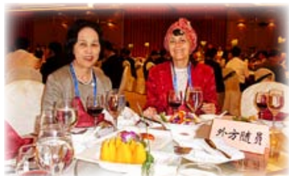
A World Cultural Forum első konferenciáján Kinában

– Nem megérzésnek nevezném, ez több annál. Racionális tudatunk csak a valóság szűk szeletét érzékeli. A testünk viszont a teljes Egészet felveszi, ezért érvényes Körbler mondása, miszerint az elmével szemben mindig a testnek van igaza. Testünk funkcionális állapota pontosan tükrözi a külvilágba való beágyazottságunkat, a külvilággal való viszonyunkat. Testünk nyelve, kommunikációs eszköze a