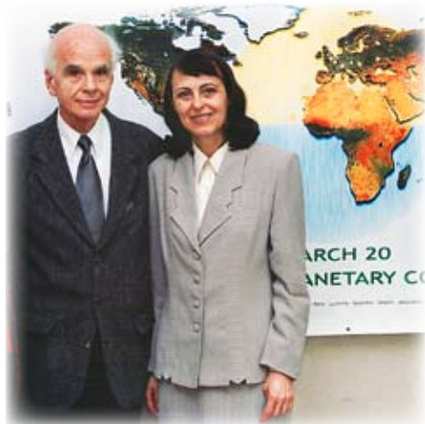
László Ervin professzorral 1991-ben

– Mindez jól beleillik László Ervin professzor filozófiájának a rendszerébe, aminek van egy másik vetülete is: a koherenciaelmélet, amire a Budapest Klub épül. Rengeteg munkád és erőfeszítésed van a Budapest Klubban. Megéri?